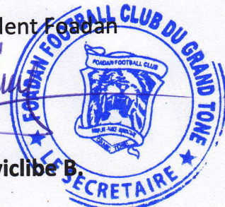
LARE Liyiclibe B.